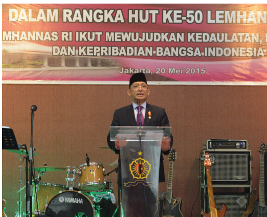
Puncak peringatan HUT Lemhannas RI ke-50, Rabu (20/5)