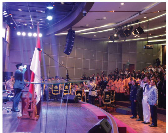
Peringatan HUT Lemhannas RI di Auditorium Gajah Mada, Rabu (20/5)