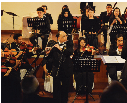
Orkestra Simfoni UI di Auditorium Gajah Mada Lemhannas RI, Sabtu (6/6)