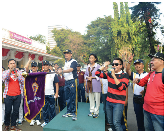
Acara pelepasan gerak jalan, Minggu (31/5)