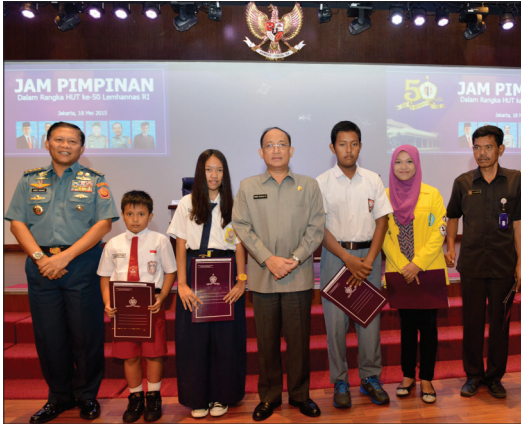
Pemberian penghargaan pada pelajar dan mahasiswa berprestasi, Senin (18/5)