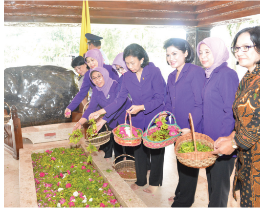
Tabur bunga oleh Ibu-Ibu Perista di Makam Bung Karno di Blitar, Selasa (12/5)