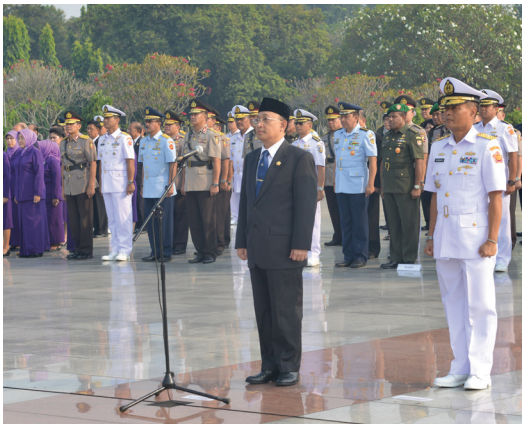
Upacara Bendera di TMP Kalibata, Selasa (19/5)