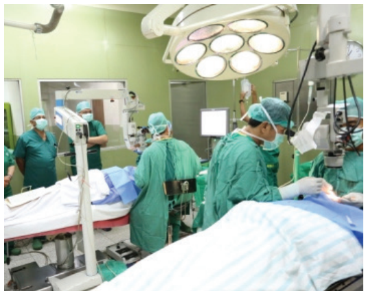
Operasi Katarak pada Bakti Sosial Lemhannas RI di RSPAD Gatot Soebroto, Rabu (3/6)