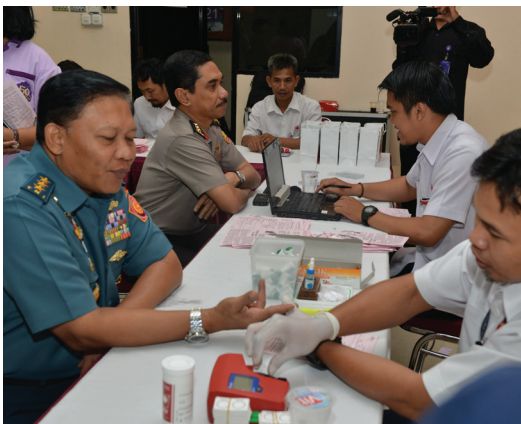
Donor darah di gedung Dwi Warna Purwa Lemhannas RI, Senin (18/5)