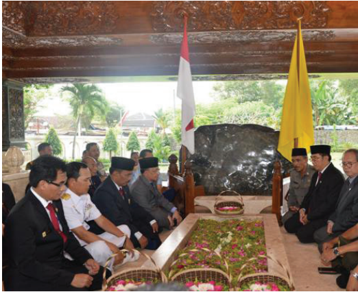
Ziarah ke Makam Bung Karno di Blitar, Selasa (12/5)