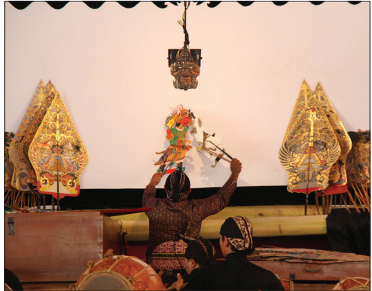
Pagelaran wayang kulit di Lemhannas RI, Jumat (29/5)