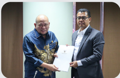
Lemhannas RI Selenggarakan FGD Konstitusionalitas Haluan Negara