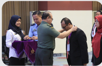
Persatuan Insinyur Indonesia Ikuti Pemantapan Nilai Kebangsaan di Lemhannas RI