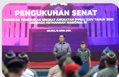
Tiga Pesan Gubernur Lemhannas RI pada Pengukuhan Senat PPSA 24