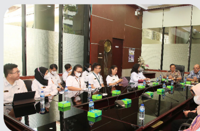
Taklimat Akhir Pemeriksaan BPK RI Atas Laporan Keuangan Lemhannas RI T.A. 2022