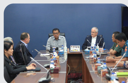
Kunjungan Delegasi U.S. Institute of Peace Washington, D.C. ke Lemhannas RI