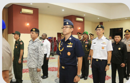
Pengukuhan Pengurus Senat PPRA 65