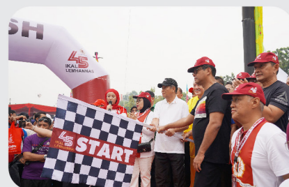
Peringati HUT ke-45, IKAL Lemhannas RI Gelar Jalan Sehat Nusantara