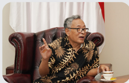
Audiensi Lembaga Kajian Center for National Security Studies