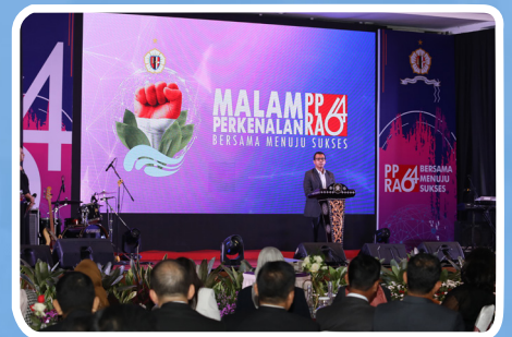
Malam Perkenalan PPRA 64