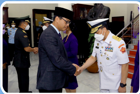
Serah Terima Jabatan Deputy Kebangsaan Lemhannas RI