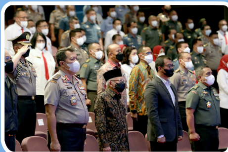
Kuliah Umum Wakil Presiden RI kepada Peserta PPRA 63 dan 64